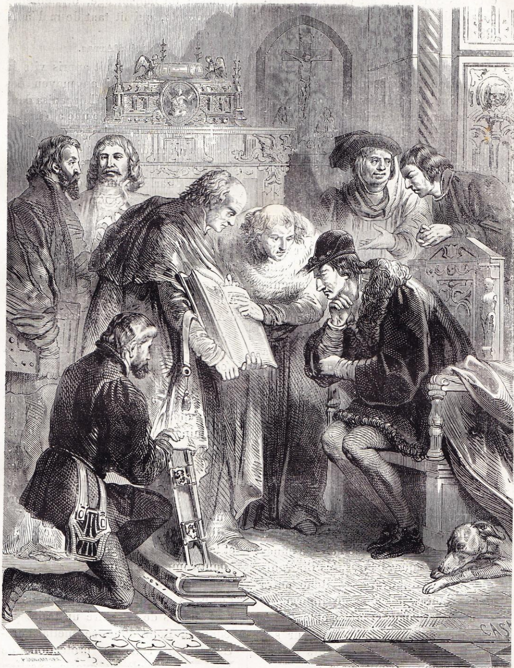
Bible présentée à Louis XI.

mort du connétable de Saint-Pol, qui monta sur l'échafaud, porta le dernier coup à la grande féodalité.